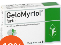
GeloMyrtol forte 20 Kapseln

Zur Vorbeugung von Vitamin-D-Mangel und bei Osteoporose.