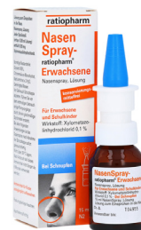
Nasenspray ratiopharm 10ml Spray

Löst den Schleim, erleichtert das Abhusten, stärkt den Bronchienschutz.