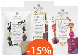
DermaSel Badesalze Wintereditionen 1 Packung