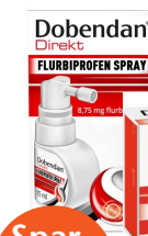
Dobendan Direkt 15ml Spray oder 24 Lutschtabl.