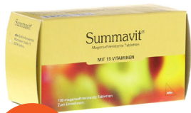
Summavit 100 Tabletten

Mit diesen Produkten gehen Sie gestärkt durch den Winter