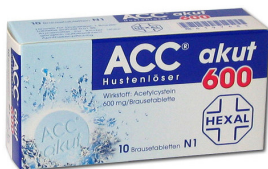
ACC akut 600 10 Brausetabletten